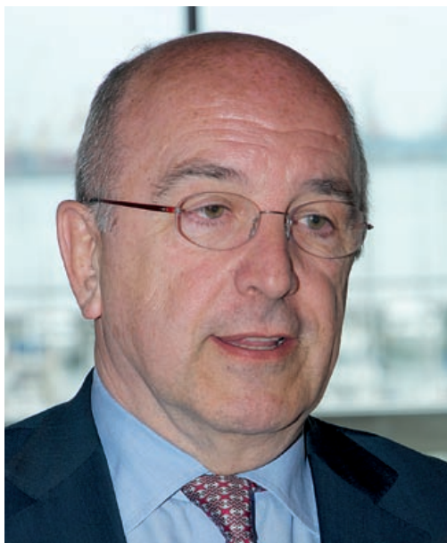
Joaquín Almunia en el transcurso de la reunión del Círculo de Empresarios Vascos celebrada el pasado 12 de abril.

El contexto económico en la UE, las reformas estructurales en diferentes estados miembros, la credibilidad internacional de la economía española, el mecanismo europeo de estabilidad financiera y el contencioso en torno a las llamadas «Vacaciones fiscales» fueron los temas centrales de la reunión en la que participó el Vicepresidente de la Comisión Europea, Joaquín Almunia.