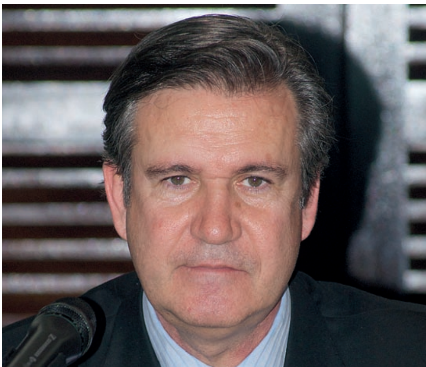
El Consejero de Industria, Comercio y Turismo, Bernabé Unda, durante la reunión del mes de marzo.

La reunión del Círculo de Empresarios Vascos del pasado mes de marzo contó con la presencia del Consejero de Industria, Comercio y Turismo, Bernabé Unda. Su ponencia abarcó los principales temas de una coyuntura económica e industrial marcada por el mantenimiento de una crisis que todavía afecta al tejido productivo vasco.